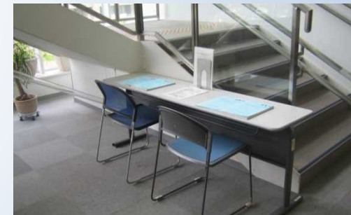
▲福岡市和白地域交流センター(コミセンわじろ)

計画段階環境配慮書の内容をご理解いただくために開催した説明会は、平成27年8月28日及び8月29日にそれぞれ、事業実施想定区域がある福岡市東区の福岡市和白地域交流センターと、福岡市都心部である福岡市役所にて開催しました。