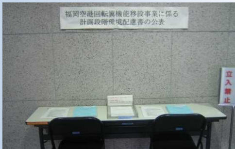
▲国土交通省大阪航空局福岡空港事務所